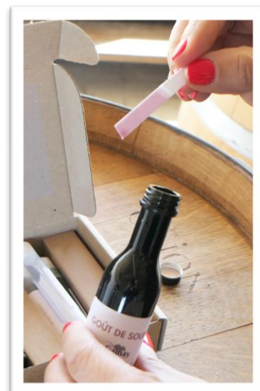
Figure 4 : Bandelettes au bicarbonate pour la révélation du goût de souris

Encore mal compris et toujours à l'étude, ce défaut ancien présente une complexité particulière. Sur le plan sensoriel, il se manifeste essentiellement en rétro-olfaction . Ses marqueurs descriptifs incluent des notes de pop-corn , cage de rongeurs , peau de saucisson ou encore riz basmati , témoignant de la difficulté à le verbaliser de manière uniforme.