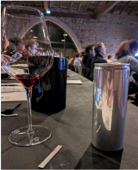
Figure 5 : Photographie d'une canette de vin anonymée