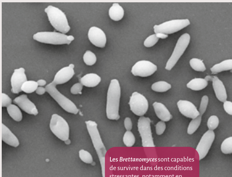
Les Brettanomyces sont capables de survivre dans des conditions stressantes, notamment en formant un biofilm.

L'étude montre que toutes les souches testées, quelle que soit leur origine, sont capables de former des biofilms sur de l'acier inoxydable (environ 10^6 cellules/cm 2 ) après 14 jours d'incubation en milieu de culture. Différents comportements souche-dépendants en fonction du traitement utilisé ont été mis en évidence. L'une des souches semble être plus tolérante à l'acide lactique quand deux autres souches sont plus tolérantes à la méthode chimique. En revanche, des levures en état VBNC font leur apparition suite à l'application de la solution soude - peroxyde. Cet état est extrêmement risqué pour la qualité