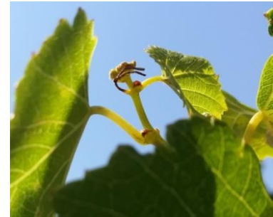
Les apex en croissance arrêtée

Lorsque les deux dernières feuilles étalées sont repliées le long de l'axe du rameau, celles-ci recouvrent l'apex.