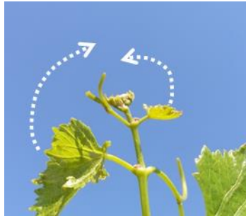
Les apex en croissance ralentie

Lorsque les deux dernières feuilles étalées sont repliées le long de l'axe du rameau, celles-ci recouvrent l'apex.