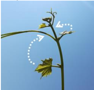
Les apex en pleine croissance

Lorsque les deux dernières feuilles étalées sont repliées le long de l'axe du rameau, celles-ci ne recouvrent pas l'apex.