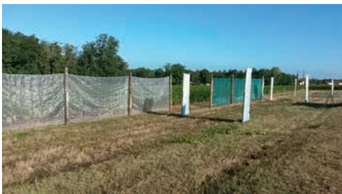
Filets positionnés à 1 et 3 mètres de la vigne et collecteurs