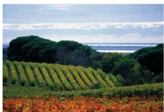
Costières de Nîmes