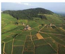
Brouilly et Côte de Brouilly