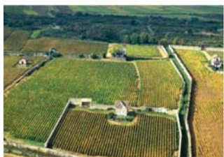
Côte de Beaune méridionale