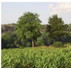
Val de Loire