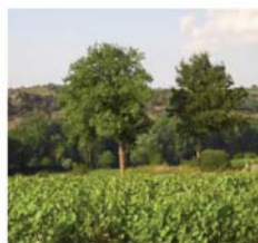
Val de Loire