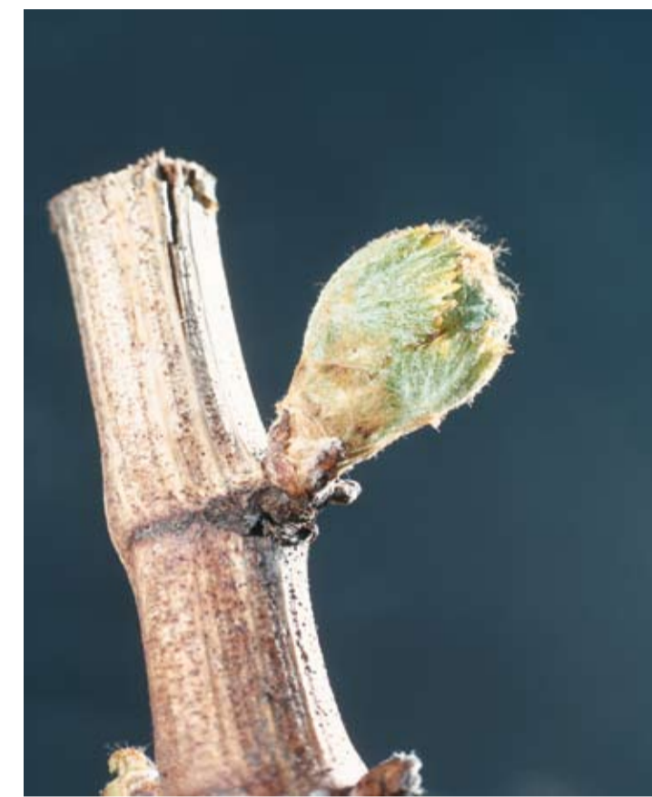
Stade C ou 05 ou 09 Pointe verte L'oeil continue à gonfler et à s'allonger. Il présente une pointe verte constituée par la jeune pousse.