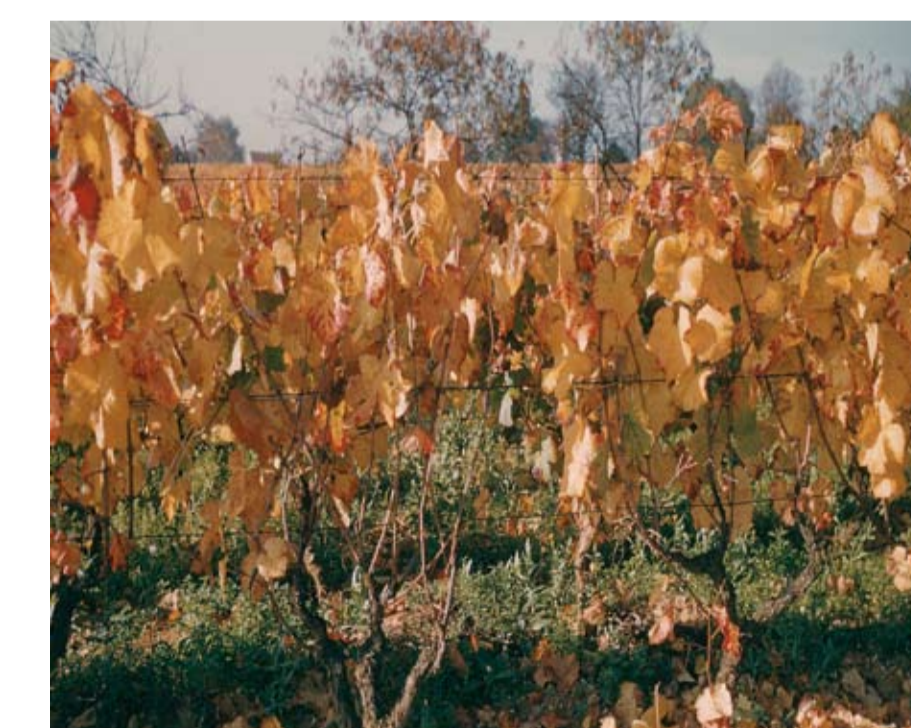
Stade O ou 43 ou 93 Début de la chute des feuilles.