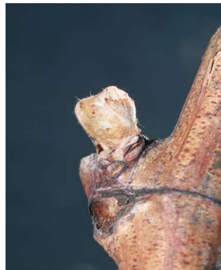
Stade B ou 03 ou 05 Bourgeon dans le coton L'oeil gonfle, ses écailles s'écartent et la bourre est très visible. Ce stade suit les pleurs.