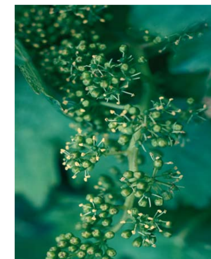
Stade I ou 23 ou 65 Floraison Les capuchons se détachent à la base et tombent. Les étamines et le pistil sont visibles. Après ce stade, vient la nouaison des grains.