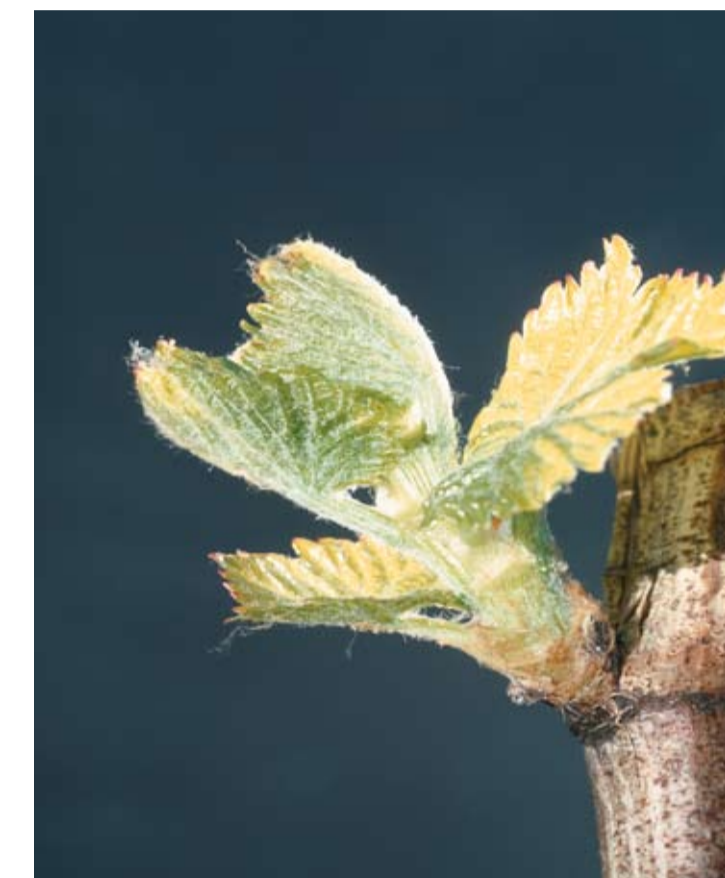
Stade E ou 09 ou 13 2 à 3 feuilles étalées Les premières feuilles sont totalement dégagées et présentent les caractères variétaux. Le rameau est nettement visible.