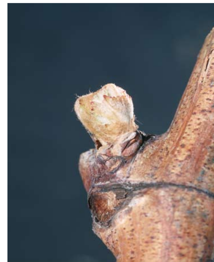
Stade B ou 03 ou 05 Bourgeon dans le coton L'oeil gonfle, ses écailles s'écartent et la bourre est très visible. Ce stade suit les pleurs.