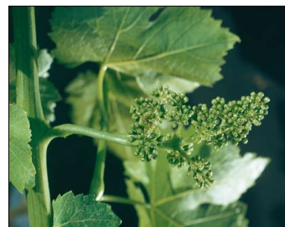
Stade H ou 17 ou 57 Boutons floraux séparés Les boutons floraux sont nettement isolés. La forme typique de l'inflorescence apparaît.