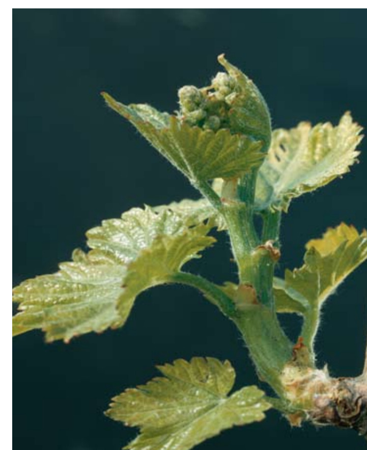
Stade F ou 12 ou 53 Grappes visibles des grappes rudimentaire apparaissent au sommet de la pousse. Quatre à six feuilles étalées sont visibles.