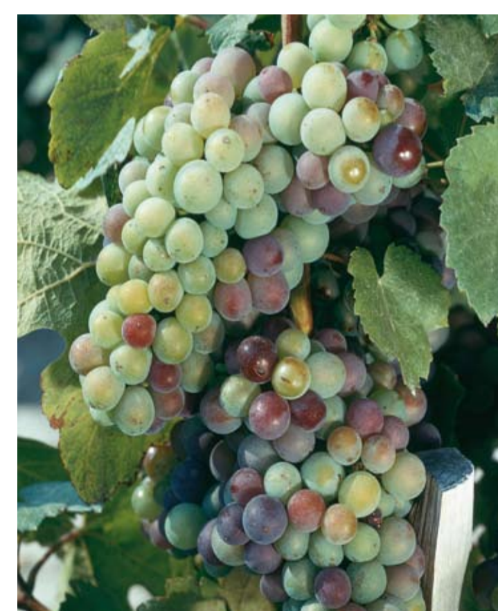
Stade M ou 36 ou 81 Véraison Les baies s'éclaircissent pour le raisin blanc ou se colorent pour le raisin noir.