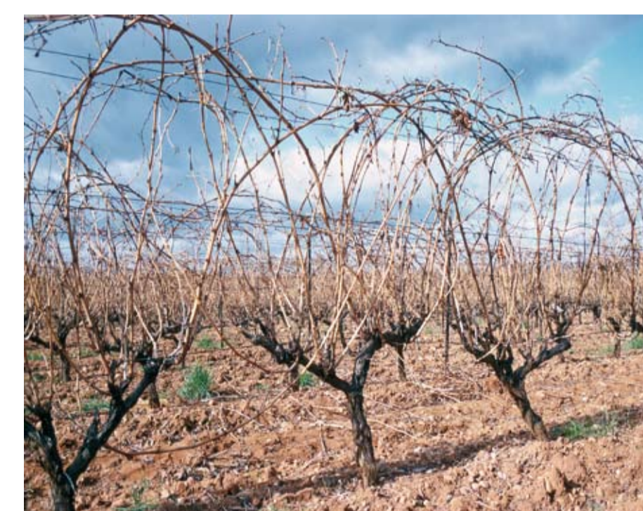
Stade 47 ou 97 Fin de la chute des feuilles à l'automne.

Depuis 1994, la notation des stades phénologiques de la vigne s'effectue suivant une échelle numérique s'étalant de 1 à 47, établie par Eichhorn & Lorenz . Cette échelle complète celle de Baggiolini , notée de A à O, surtout au niveau de la floraison. Enfin, il existe une échelle universelle pour toutes les monocotylédones et les dicotylédones, appelée BBCH (Biologische Bundesanstalt bundessortenamt and CHEmical industry). Chaque stade est défini par une lettre et deux chiffres dans l'ordre : Baggiolini, Eichhorn & Lorenz et BBCH .