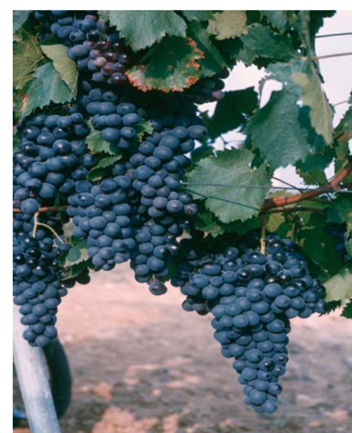
Stade N ou 38 ou 89 Maturité Les baies sont prêtes pour la récolte car elles ont atteint leur maturité technologique.