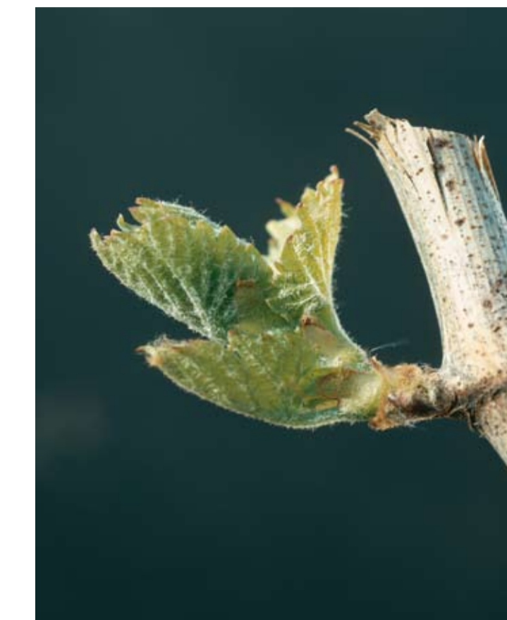
Stade D ou 06 ou 11 Sortie des feuilles Des feuilles rudimentaires rassemblées en rosette apparaissent. Leur base est encore protégée par la bourre progressivement rejetée hors des écailles.