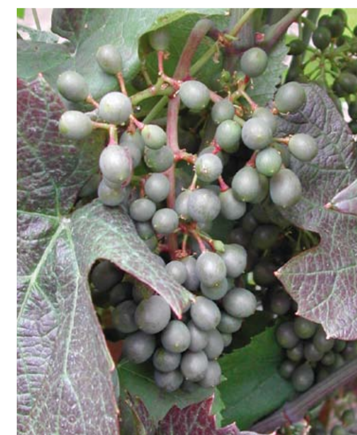
Stade K ou 31 ou 75 Petit pois Les grains ont la taille d'un petit pois. Les grappes pendent.