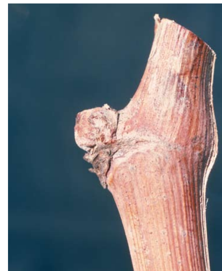
Stade A ou 01 ou 00 Bourgeon d'hiver L'oeil de l'année précédente est presque entièrement recouvert par deux écailles protectrices brunâtres.

L'Institut Français de la Vigne et du Vin conduit des missions de portée générale pour l'ensemble de la filière viti-vinicole, dans les domaines de la sélection végétale, de la viticulture, de la vinification et de la mise en marché des produits. L'IFV est implanté dans l'ensemble des bassins viticoles grâce à ses stations régionales.