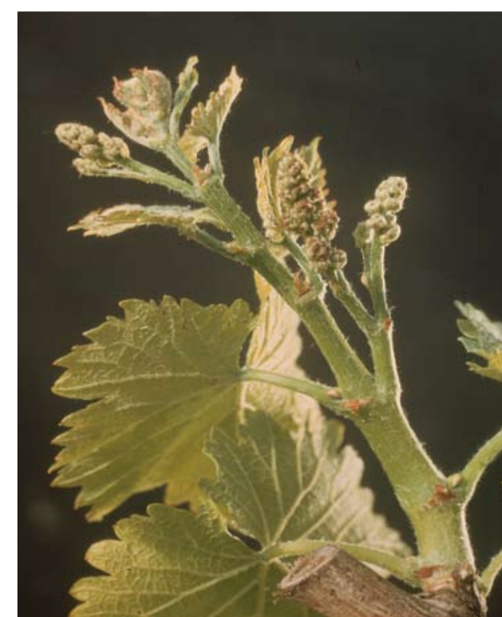
Stade G ou 15 ou 55 Boutons floraux encore agglomérés Les grappes s'espacent et s'allongent sur la pousse. Les boutons floraux sont encore agglomérés.