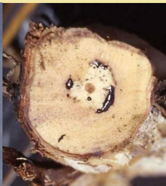
Maladie de Petri